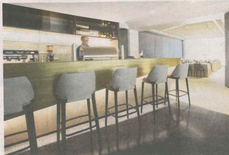
Inmitten des Restaurantbereiches befinden sich Bar und Lounge.

Durch den Bau einer neuen Produktionshalle mit 1000 m 2 Fläche unmittelbar neben dem „NatURSPIELplatz“ der Firma Pagitsch ergab sich die Möglichkeit zur Gestaltung des Obergeschosses. Entstanden sind ein Restaurant mit Platz für bis zu 380 Personen und eine Dachterrasse, die einen unvergleichlichen 360-Grad-Panoramablick ermöglicht: „Künftig ist von Seminaren, Veranstaltungen bis hin zu Hochzeiten vieles bei uns möglich. Wir haben auch schon einige Buchungen“, sagt der Unternehmer, der sich im Trockenbau vor allem mit Akustikdecken und Klimatisierung international einen Namen gemacht hat. Während zu Mittag Kinder und An-