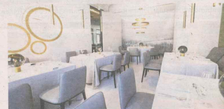
Das Restaurant „Goldader“ bietet Platz für bis zu 380 Personen.